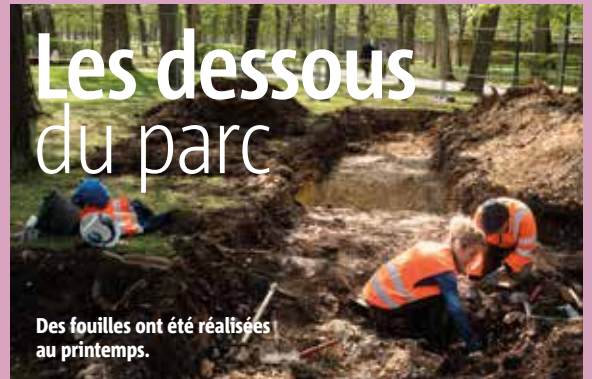
Des fouilles ont été réalisées au printemps.

Des fouilles archéologiques préventives ont été réalisées en avril dans le parc de Blossac. L'enjeu ? Mieux connaître l'histoire du site dans la perspective de la réfection de l'allée principale et d'éventuelles actions ultérieures d'embellissement du parc. L'Institut de recherches archéologiques préventives (INRAP) a fouillé trois zones dont le périmètre a été déterminé par la DRAC. Les découvertes ? Du mobilier datant de la période gauloise jusqu'au XIX e siècle ainsi que les fondations d'un bâtiment. Tous les éléments mis au jour sont en cours d'analyses. La DRAC devra déterminer, au regard des résultats de ces travaux, si d'autres fouilles sont requises avant d'envisager de futurs travaux. Le parc de Blossac fait l'objet d'un plan de gestion, c'est-à-dire d'une programmation à 20 ans. Il s'agit d'assurer une permanence de l'esthétisme du parc, de renouveler l'offre de ce lieu de loisirs et de détente tout en préservant son identité patrimoniale.