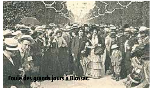
Foule des grands jours à Blossac.