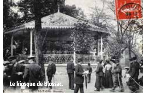
Le kiosque de Blossac.